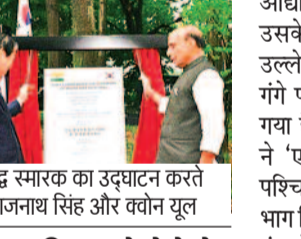
युद्ध स्मारक का उद्घाटन करते राजनाथ सिंह और क्वोन यूल

रक्षा मंत्री राजनाथ सिंह और दक्षिण कोरिया के पूर्व सैनिक मामलों के मंत्री क्वोन ओह-यूल ने बुधवार को सियोल के इमजिनगेक पार्क में भारतीय युद्ध स्मारक का संयुक्त रूप से उद्घाटन किया। कोरियाई युद्ध की 75वीं वर्षगांठ के अवसर पर निर्मित यह स्मारक भारतीय सैनिकों के साहस, बलिदान और मानवीय सेवा को समर्पित है। यह स्मारक कोरियाई युद्ध के दौरान भारतीय सेना की 60 पैरा फील्ड एम्बुलेंस और कस्टोडियन फोर्स ऑफ इंडिया (सीएफआई) की वीरता और मानवीय योगदान की याद में बनाया गया है। भारतीय युद्ध स्मारक उसी क्षेत्र में स्थापित किया गया है जहां 1954 में सीएफआई ने 'हिंद नगर' की स्थापना की थी। यहां लगभग 22 हजार युद्धबंदियों को शांतिपूर्ण प्रत्यावर्तन तक रखा गया था। इस परियोजना को भारत सरकार के रक्षा मंत्रालय के वित्तीय सहयोग से विकसित किया गया है।