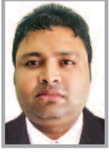
(लेखक स्वतंत्र पत्रकार है, ये उनके अपने विचार हैं।)